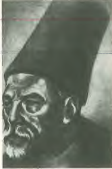
İsmail Dede Efendi

Birkaç gün önce Yenikapı Mevlîhânesi’nin müdâvimlerinden bir şair, belki besteler diye İsmail Dede’ye bir şiir vermişti. “Ser-i zülfi anberînin yüzüne nikab edersin” mısraıyla başlayan bu şiiri Dede çok beğenmiş, “bu tam bir yürük-semâî güftesi” demişti. Hangi makamdan bestelesem diye düşündüğü bir sırada Hâfız çıkagelmiş, Sultan Selim’in yeni terkiibini haber vermiş-