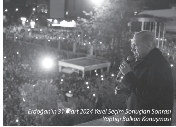
Erdoğan’ın 31 Mart 2024 Yerel Seçim Sonuçları Sonrası Yaptığı Balkon Konuşması

“31 Mart seçimlerinde, önümüzdeki beş yılın yerel yöneticileri belirlenmiştir.” “Bu kapsamda Milliyetçi Hareket Partisi ve Cumhuriyet İttifakı’nın çok cepheli mücadelesine karşılık DEM takviyeli Cumhuriyet Halk Partisi’nin konjonktürel kimi rahatsızlık ve memnuniyetsizlikten istifade ederek sivrildiği açıktır.” “Fakat Türkiye’yi yöneten iktidar değişmemiştir. Sanki iktidar değişikliği olmuş gibi dedikodu çıkaran, erken seçim yaygarası koparan, bu kapsamda akıl tutulması yaşayan çevrelerin şuursuzca hareket etmesi tek kelimeyle aymazlık ve ahlaki çarpıklıktır. Cumhurbaşkanlığı kabinesi görevinin başındadır.” “Her alanda atılım ve reform hamlelerine kararlılıkla devam edecektir.” “Cumhurbaşkanımız Sayın Recep Tayyip Erdoğan devletin başıdır ve desteğimiz sonuna kadar arkasındadır.”