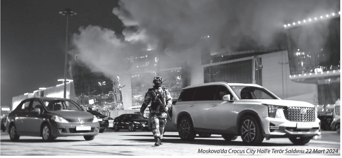
Moskova'da Crocus City Hall'e Terör Saldırısı 22 Mart 2024

Putin'in, Rus ruhunun derinliğiyle bağlantı kurmayı başardığına inanıyorum. Sovyetler Birliği'nin çöküşünden sonra, Moskova sokaklarında Joseph Stalin dönemine özelemlerini dile getiren yaşlı insanlar gördüm. Ruslar, kaderleri ile oynasa ve boyunlarını vursa bile güçlü bir hükümdarı severler.